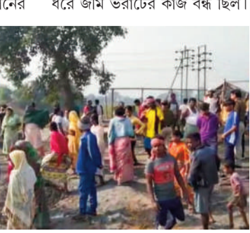
তিন মাস পর আবারও জমি ভরাটের কাজ শুরু করা হলে স্থানীয় লোকজন কাজে বাধা দেয়।

মাঝিয়ারা তাদের জমি দখলের চেষ্টা করছে। এ এলাকায় বাড়িঘরের তৈরি হলে