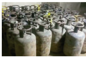
করে বর্ধমানের ওপর দিয়ে যাওয়ার সময় ওই গাড়িটিকে আটক করে পুলিশ।

মেমারি থানা এলাকা থেকে অবৈধভাবে মজুদ করা গ্যাস সিলিন্ডার একাধিকবার বাজেয়াপ্ত করা হয়েছে।